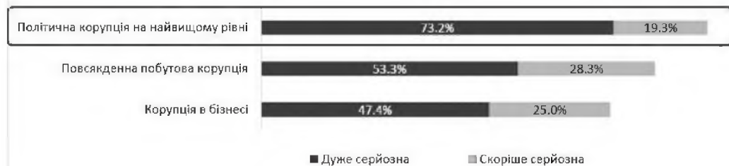
Рис. 2. Серйозність корупційних проблем

з нею респондентів. У масовій свідомості аналогічний поділ є стійким стереотипом, що стає найбільш поширеним способом мотивації виправдання корупції.