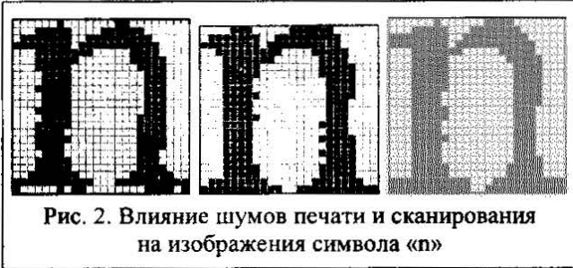
Рис. 2. Влияние шумов печати и сканирования на изображения символа «п»

На рис. 2, взятом из работы [8], представлены три случайно выбранные изображения буквы «п» из различных 257, входящих в изображение страницы текста формата А4, при разрешении сканирования 300 dpi.