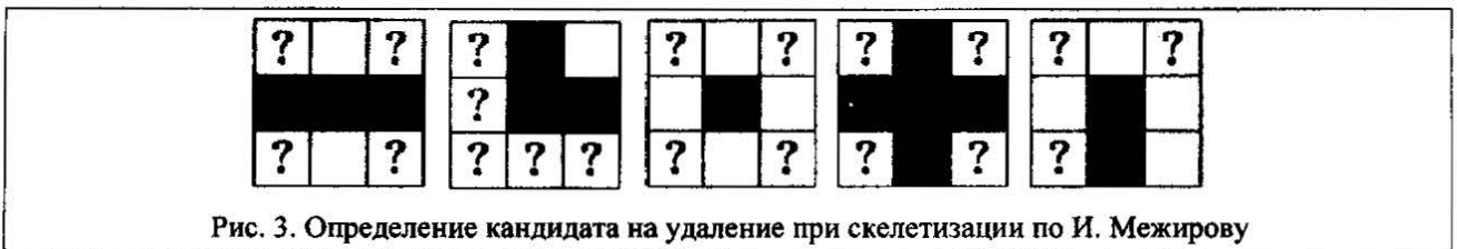
Рис. 3. Определение кандидата на удаление при скелетизации по И. Межирову

Первые два правила, представленных графически на рис. 4, означают, что связность буквы относительно переходов от пикселя к одному из его четырех соседей не должна нарушаться. Третье правило запрещает удаление одиночных пикселей. Четвертое правило означает, что только пиксели с границы черного и белого могут быть удалены. Пятое правило помогает сохранить форму буквы при очистке, запрещая удалять «выступающие» пиксели.